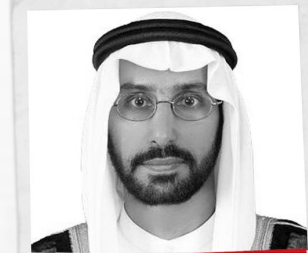
القاضي: أحمد الزعابي