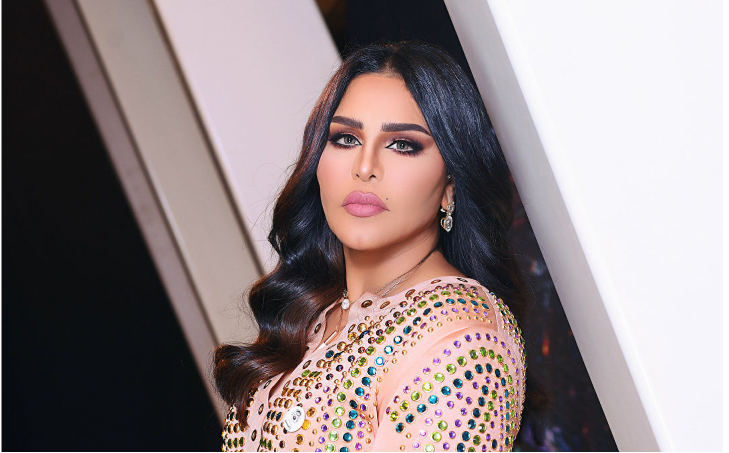
الفنانة الإماراتية أعلام الشامسي

خاص - الإمارات 71 تاريخ الخبر: 2022-01-12